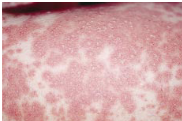
FIG. 1.—Exantema formado por pequeñas pústulas en ocasiones confluentes sobre una base eritematosa.

La biopsia realizada mostraba a nivel de toda la dermis un infiltrado perivascular linfocitario y numero-