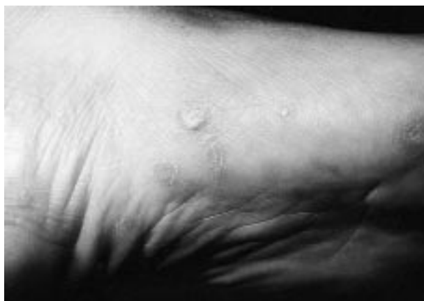
FIG. 1.—Aspecto clínico de las lesiones agrupadas en arco plantar con pápulas de diferente morfología.

El estudio histopatológico de una de las lesiones palmares (Fig. 2) mostró una epidermis acantósica irregular «en dientes de sierra», con hiperqueratosis ortoqueratósica e hipergranulosis focal. En la dermis papilar había un denso infiltrado linfocitario en banda, bien demarcado en su límite inferior y que contactaba con la capa basal en su porción superior; ésta mostraba una degeneración licuefactiva con formación de hendiduras entre epidermis y dermis y presencia de cuerpos coloides de Civatte. Todos estos hallazgos confirmaron que se trataba de un liquen plano.