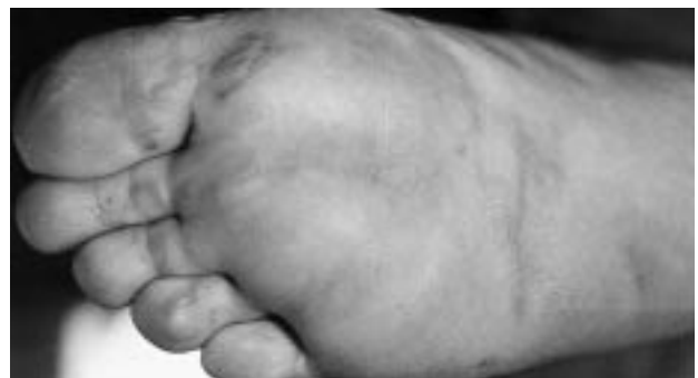
FIG. 1.—Caso 1. Lesiones vesiculoampollosas en los dedos y serpiginosas en la planta.

En la analítica general, placa de tórax y cultivo de hongos y bacterias no se apreciaron resultados de interés. La biopsia del extremo de una de las lesiones lineales reflejó un infiltrado inflamatorio de predominio perivascular, intensa espongirosis y con vesículas espongióticas, rellenas de material fibrinoide. Con tiabendazol tópico al 6,25% dos veces al día las lesiones desaparecieron en el curso de 8 días.