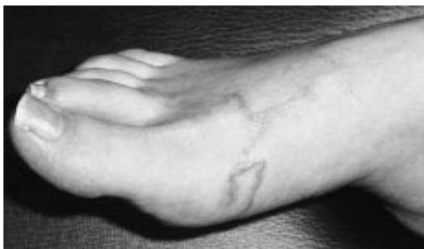
FIG. 2.—Caso 2. Lesiones serpiginosas elevadas en dorso y cara lateral del pie.