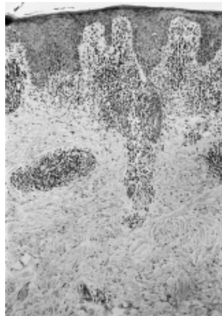
Fig. 3.—Infiltrado linfocitario perivascular en dermis superficial y media.

tematosas, pruriginosas, que van progresando hacia la formación de lesiones induradas en forma de placas y nódulos de coloración rojo-violácea; se puede acompañar de ulceración, eritema, queratosis pilar y descamación difusa, y como manifestaciones tardías pueden aparecer edema y fibrosis. Se resuelve en unas semanas, dejando una hiperpigmentación residual. El resto de la exploración física es normal, no apareciendo lesiones en zonas acras 6 . El principal factor etiológico es una exposición prolongada al frío, aunque también influyen el uso de prendas de vestir ajustadas, no aislantes, un tipo de circulación especial y una susceptibilidad individual al frío 2,3 .