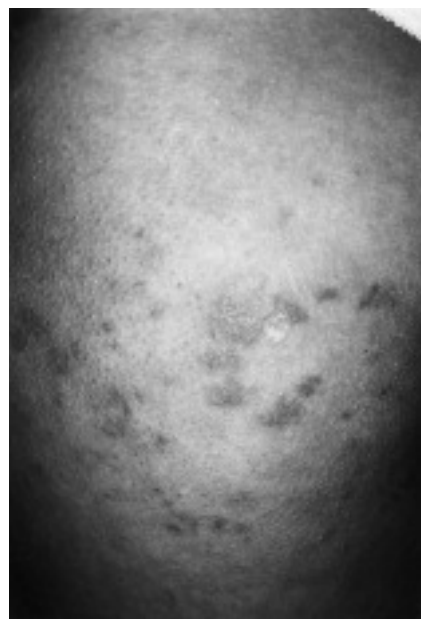
Fig. 1.—Lesiones eritematovioláceas a nivel de cara superoexterna de muslo.

No se encontraron alteraciones en la analítica general ni en el estudio inmunológico, que incluía autoanticuerpos, anticuerpos anticardiolipina, complemento, inmunoglobulinas, factor reumatoide y estu-