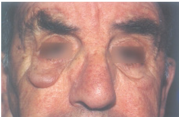
Fig. 1.—Piel laxa edematosa de aspecto translúcido en párpado inferior derecho.