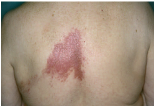
Fig. 4.—Caso 3. Lesiones en placa eritematosa en espalda y costado.

titud el intervalo y el tercero hacía un mes), refería que al cicatrizar las lesiones del último episodio de herpes zóster, le había aparecido en la región frontal media una lesión atrófica con aspecto cicatricial, asintomática (fig. 3). La biopsia mostró una dermatitis granulomatosa constituida por linfocitos, células plasmáticas y células gigantes multinucleadas, con vasculitis linfocitaria focal.