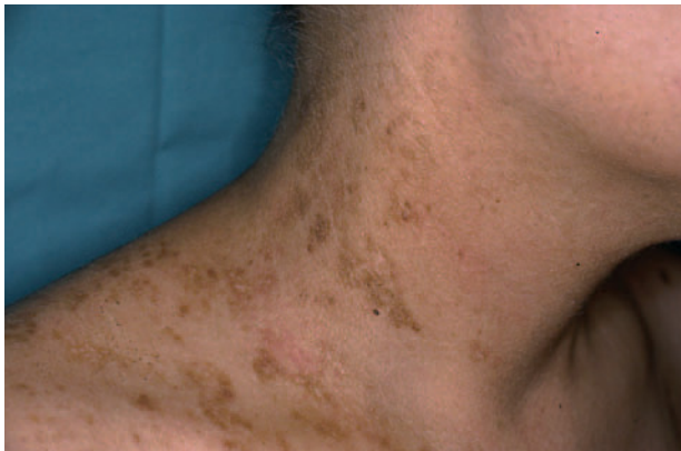
Fig. 1.—Caso 1. Pápulas liquenoides en cuello y hombro.