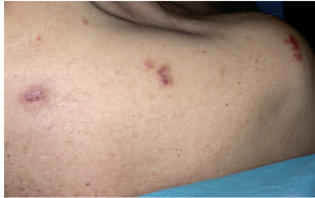
Fig. 5.—Caso 4. Nódulos eritematosos en hombro derecho.