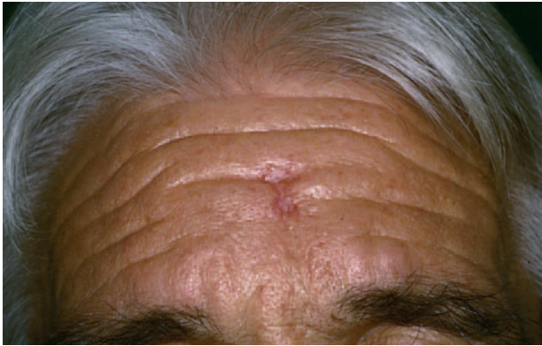
Fig. 3.—Caso 2. Cicatriz deprimida en frente.