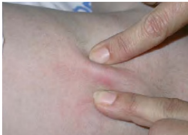
Fig. 1.—Placa subcutánea indurada en la zona media de la espalda.

El estado general de la niña era aparentemente bueno. Se observó una placa eritematosa, empastada al tacto, profunda y desplazable, de 2 cm de diámetro (fig. 1). Además, tenía dos nódulos de menor tamaño