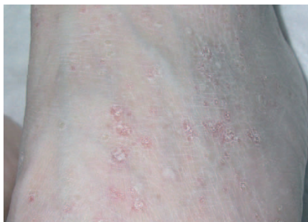
Fig. 1.—Pápulas queratósicas de diferente tamaño en el dorso del pie de nuestra paciente.

Los exámenes complementarios solicitados: hemograma, bioquímica general y sedimento urinario, no mostraron alteraciones significativas. Se realizó biopsia en sacabocados de una de las lesiones (fig. 2).