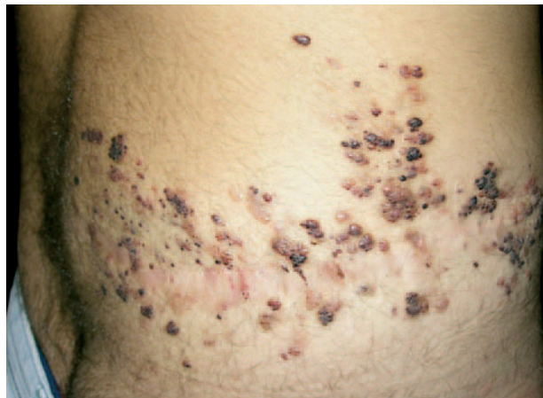
Fig. 1.—Múltiples vesículas agrupadas que sugieren la clínica de linfangioma circunscrito neviforme.

En nuestro caso la recidiva tras una intervención previa, así como la existencia de una masa retroperitoneal mal definida asociada, nos llevaron a adoptar una actitud expectante.