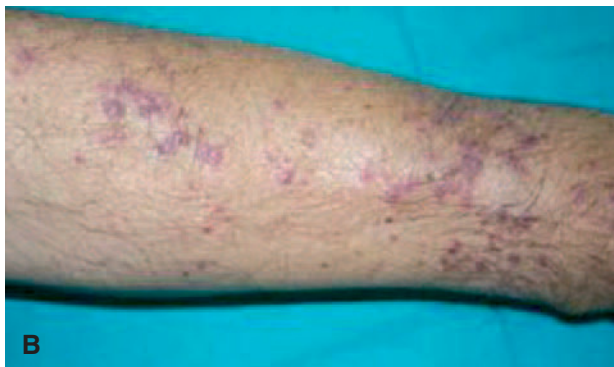
Lesiones maculares y papulares de coloración violácea, que confluyen formando placas en el antebrazo izquierdo (A) y derecho (B).

nuestro país, reinició hemodiálisis, practicándose una fístula arteriovenosa braquiocéfálica en antebrazo derecho.