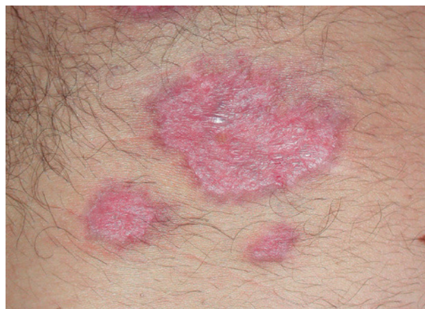
Pioderma gangrenoso tras 6 semanas de iniciar el tratamiento con infliximab intravenoso; puede apreciarse que las lesiones han cicatrizado.

Se han descrito dos casos de Sweet asociados a eritema nudoso tratados con infliximab, en los que se obtuvo una buena respuesta a las dosis y pautas habituales utilizadas con este fármaco 103,104 .