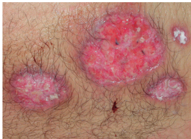
Pioderma gangrenoso en un paciente con colitis ulcerosa.

Hasta la actualidad sólo se han descrito 5 casos de Síndrome de Sweet (SS) tratados con infliximab, respondiendo adecuadamente 4 de los 5 y sólo de forma temporal e inicial uno de ellos.