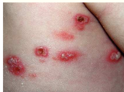
Figura 1. Lesiones cutáneas al ingreso.

La analítica sanguínea del neonato, incluyendo estudio inmunitario básico (inmunoglobulinas y subpoblaciones linfocitarias), fue normal. El hemocultivo y el cultivo estándar de las lesiones