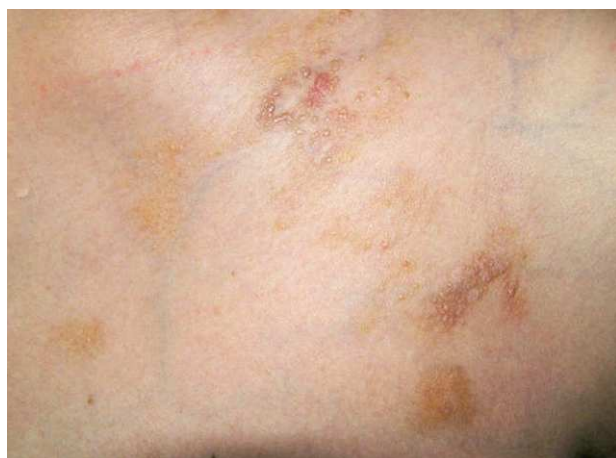
Figura 3. Pápulas brillantes, superficie lisa, de escasos milímetros de diámetro en región supraclavicular.