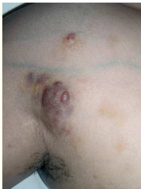
Figura 2. Nódulo eritematoso, infiltrado al tacto, en pliegue axilar.

inicio se mostraban más infiltradas al tacto, con un aspecto más nodular (fig. 2). En la región preesternal y supraclavicular también se podían apreciar pequeñas pápulas hemisféricas brillantes, de color piel y superficie lisa, con