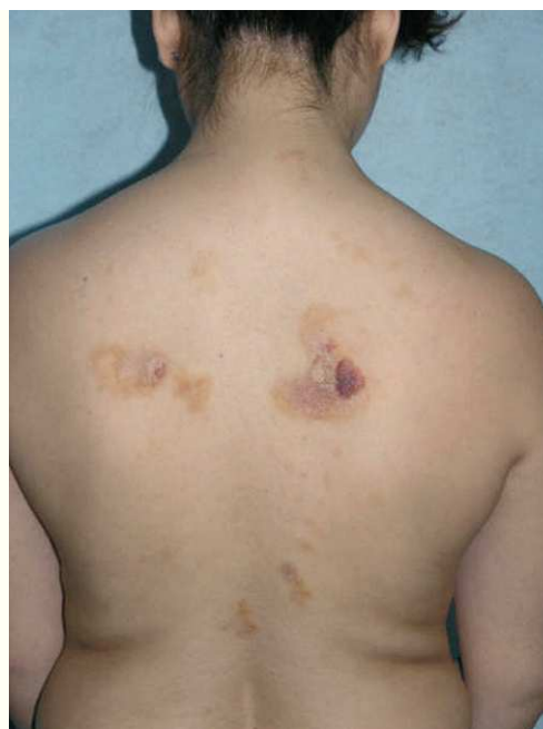
Figura 1. Máculas y pápulas confluyentes en placas, con marcada discromía (coloración marrón-amarillenta, color piel y eritematopurpúrica) y morfología variada, situadas en la espalda de la paciente.

habían resuelto totalmente al llegar a la adolescencia. Fue referida a nuestras consultas para valoración de varias lesiones cutáneas asintomáticas que habían ido apareciendo progresivamente en los dos años previos y que no remitían con diversos tratamientos tópicos pautados. Las lesiones se habían iniciado en los pliegues inguinales, pliegues axilares y la cara interna de muslos, y paulatinamente habían aumentado de tamaño, al tiempo que otras nuevas aparecieron en la espalda, región preesternal, el abdomen inferior y la vulva. Por otro lado, la paciente conservaba un buen estado general, y no se constató ninguna otra sintomatología adicional. En la exploración física se objetivó la presencia de lesiones maculopapulosas confluyentes en placas de morfología lineal y redondeada, de tamaño variado, que oscilaban desde varios milímetros hasta 6 u 8 cm de diámetro, con bordes bien delimitados, aunque irregulares, y superficie lisa o rugosa según la localización. Las lesiones experimentaban una clara discromía, predominando en algunas un color marrón-amarillento y en otras una tonalidad eritematopurpúrica con áreas de color piel semejante a la piel adyacente (fig. 1). En las localizaciones de