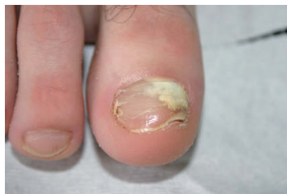
Figura 1. Coloración blanquecina en tercio proximal de lámina y matriz ungueales.

La onicomiosis blanca subungueal proximal (OBSP) es la forma menos habitual de presentación de la onicomiosis. Como agente causal más frecuente destaca el Trichophyton rubrum , aunque también se han visto implicadas otras especies: Trichophyton megninii , T. schoenleinii , T. tonsurans , T. mentagrophytes y E. floccosum .