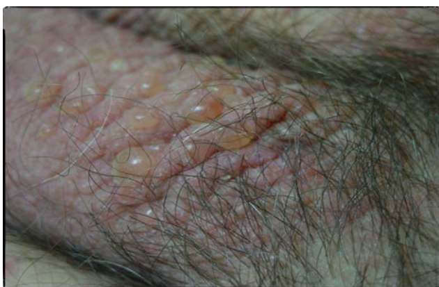
Figura 3 Ampollas tensas en el escroto.