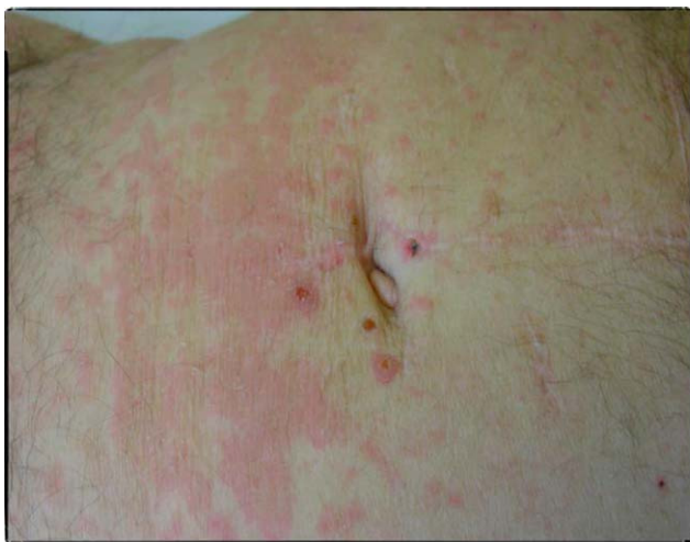
Figuras 1 y 2 Placas eritematoescamosas con lesiones de rascado en el tronco.