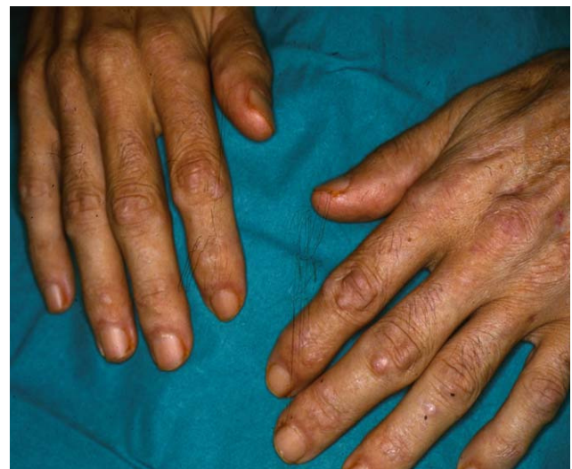
Figura 1 Nódulos en el dorso de ambas manos, que predominan en las áreas periarticulares.

El cultivo de piel sana fue negativo. La identificación de Leishmania por reacción en cadena de la polimerasa fue positiva en la piel lesional y en sangre, y negativa en la piel sana.