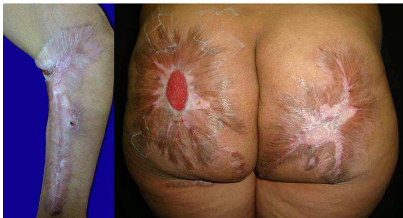
Figura 3 Fotografía de control a los 7 meses. Se observa re-epitelización de las lesiones y cicatrices.

No existe consenso para el manejo de estos pacientes, habiéndose publicado buenos resultados con el uso