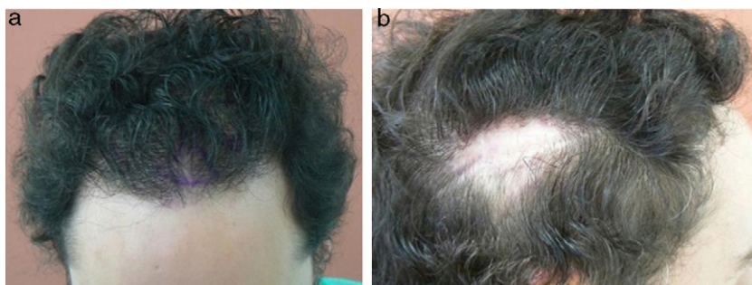
Figura 1 a. Aspecto de la región fronto-temporal del paciente después de un primer trasplante capilar convencional. b. Aspecto de la zona donante de la región parieto-temporal.

Las alopecias cicatriciales secundarias a quemaduras, cirugía, traumatismos o radioterapia son una indicación excelente para el trasplante capilar 5-7 . El paciente presentado desarrolló una cicatriz iatrogénica parietal tras