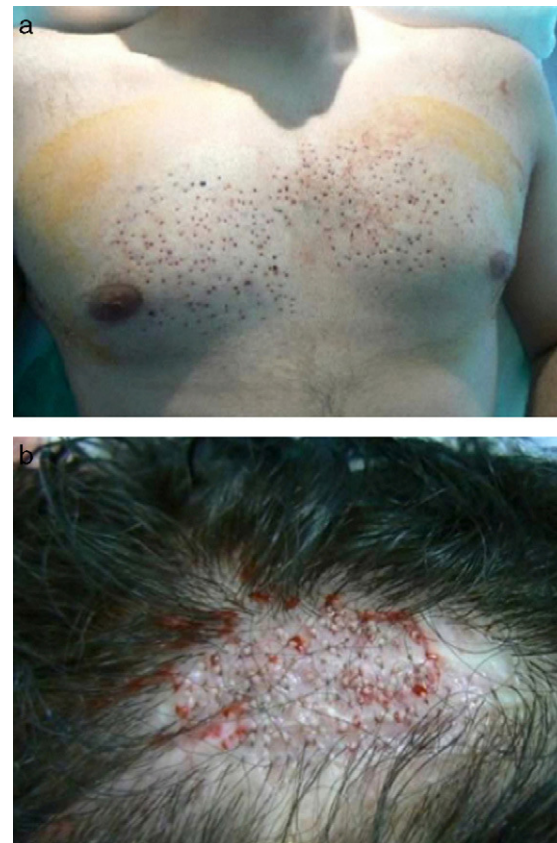
Figura 2 a. Zona pectoral donante tras la extracción de las unidades foliculares. b. Implantación de unidades foliculares corporales en la cicatriz.

De los 335 UF corporales obtenidas, 100 se implantaron en la cicatriz de la región temporo-parietal para valorar la respuesta (fig. 2b), y el resto UF corporales junto con otras 600 UF obtenidas de la región parieto-occipital se implantaron en la región frontal.