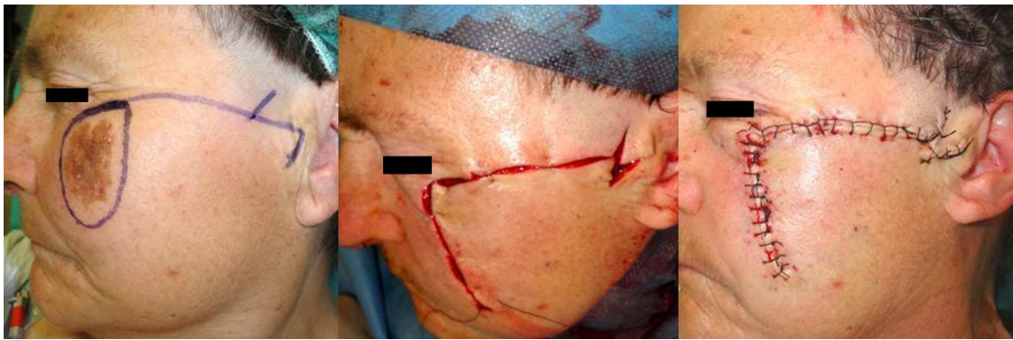
Figura 1 Colgajo de avance-rotación asociado a una Z-plastia.