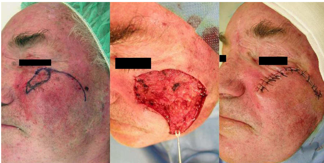
Figura 3 Colgajo de rotación-avance.