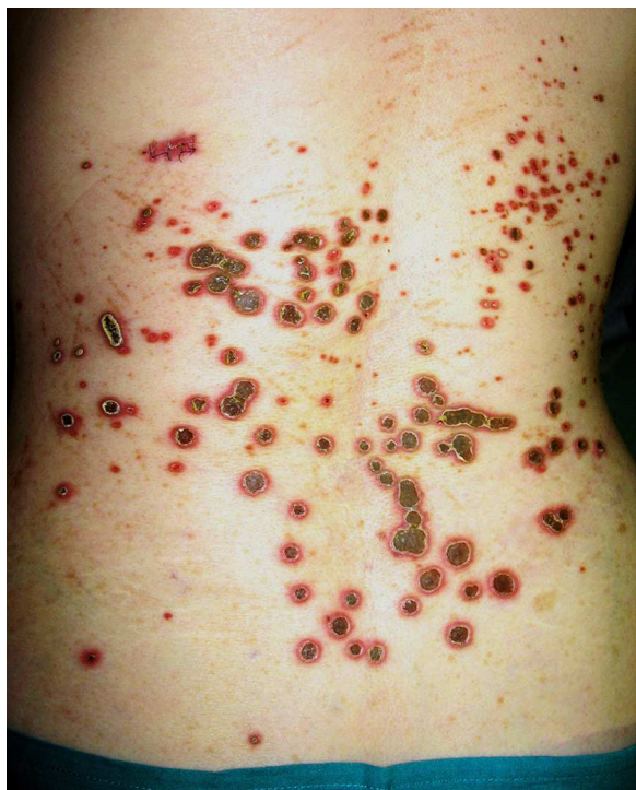
Figura 1 Múltiples pápulas y placas dorso-lumbares en paciente 6, con tapón hiperqueratósico central y halo eritematoso.

la terminología. En la actualidad la mayoría de los autores denominan CPR a la forma hereditaria, y se prefiere el término de dermatosis perforante adquirida (DPA), propuesto por Rapini et al., para la forma del adulto y para cualquier afección perforante clínica e histológicamente similar a las clásicas que se presente asociada a una enfermedad sistémica 1 .