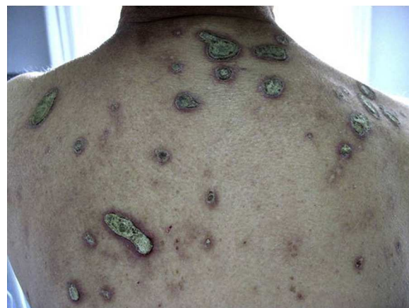
Figura 2 Paciente 8 con lesiones localizadas en la espalda de mayor tamaño.

Presentamos 8 casos de DPA, 3 varones y 5 mujeres, con una edad media de 73 años (tabla 1). El tiempo de evolución