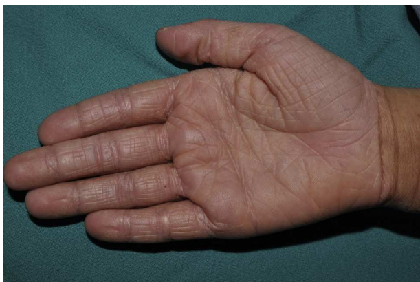
Figura 3 Hiperlinealidad palmar en un niño de 7 años de edad con ictiosis vulgar.

una extensa investigación de la relación existente entre las mutaciones en el gen FLG y las enfermedades atópicas, que ha ofrecido datos reveladores sobre la patogénesis de estos trastornos complejos.