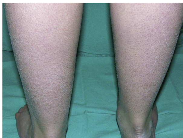
Figura 2 Descamación fina de tono claro en paciente con ictiosis vulgar.

La IV es el trastorno de queratinización más frecuente, con una prevalencia estimada de entre 1/80 a 1/250 niños ingleses en edad escolar 15 , y es la enfermedad de herencia mendeliana causada por las mutaciones en el gen FLG 31 . Ya en los años ochenta se describió la ausencia (o marcada reducción) de los gránulos de queratohialina en biopsias de pacientes con IV, así como una disminución en la expresión de filagrina detectada por técnicas de inmunotinción 36 . Sin embargo, hasta 2006 no se identificaron las mutaciones de pérdida de función en el gen FLG como causantes del proceso 29 , una demora ocasionada por la gran longitud del gen y su secuencia altamente repetitiva, que hacía difícil su secuenciación mediante técnicas de PCR convencionales 15 . El descubrimiento de estas mutaciones permitió aclarar el patrón de herencia de la enfermedad, que es autosómica semidominante, lo cual explica a su vez