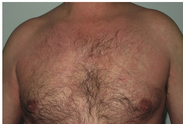
Figura 3 Toxicodermia por telaprevir: lesiones eritematosas en hemicuerpo superior de paciente varón.

tratamiento, de una vasculitis cutánea extensa. En el segundo caso telaprevir se suspendió casi al final de la semana 11 de tratamiento, por progresión desde grado 2 a grado 3 de las lesiones, sin que esto repercutiera en la efectividad de la terapia antiviral. Ambos pacientes en los que se suspendió el telaprevir eran pacientes no tratados con el tratamiento antiviral y no tenían antecedentes de dermatosis previas. Ninguno de los 20 pacientes diagnosticados de toxicodermia requirió hospitalización por este motivo.