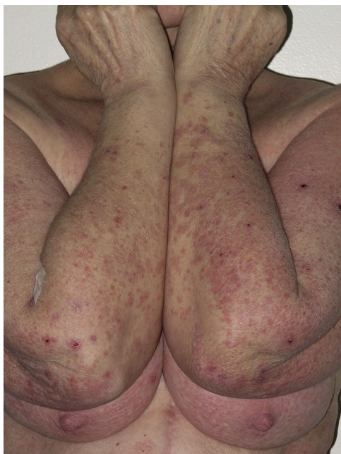
Figura 4 Placas eritematovioláceas excoriadas en paciente mujer con toxicodermia por telaprevir.

historia previa de toxicodermias por tratamientos anti-VHC en aquellos pacientes previamente tratados. Es así como se desprende que de la visita basal 25 pacientes (58% del total) habían sido tratados previamente con IFN y ribavirina, y que 6 de estos pacientes (24% de los previamente tratados) habían presentado una reacción cutánea previa, en todos los casos leve.