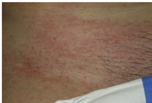
Figura 2 Lesiones en forma de máculas y pápulas eritematosas en el tronco de una paciente afectada por toxicodermia grado 1 por telaprevir.

Para descartar otros procesos cutáneos y realizar la correlación clinicopatológica, se realizó una biopsia