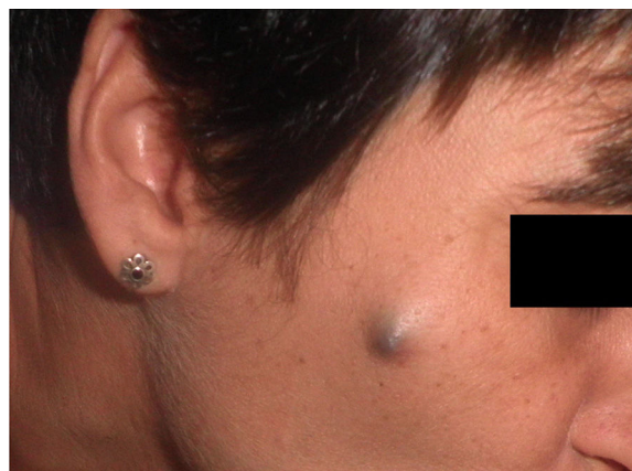
Figura 1 Nódulo en mejilla derecha

La lesión fue extirpada en su totalidad, y el estudio histopatológico mostró una lesión dérmica multinodular, bien delimitada, con atipia citológica, mitosis y áreas de necrosis, sin conexión con la epidermis ni con el epitelio folicular (figs. 2A y D). Se realizaron marcadores inmunohistoquímicos