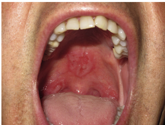
Figura 1 Lesiones en forma de erosiones en el paladar duro y el pilar tonsilar derecho.

A la exploración física presentaba lesiones erosivas en el paladar duro y en el pilar amigdalino derecho (fig. 1), así como dificultad en la deglución. En la exploración oftalmológica había una lesión placoide, de gran tamaño, circular y de coloración amarillenta localizada en el epitelio pigmentado de la retina, en la mácula. La lesión se extendía hasta las arcadas vasculares supero-temporales del ojo derecho (fig. 2A). La agudeza visual era de 20/50. Se orientó