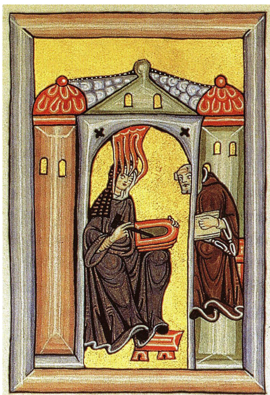
Figura 1 Hildegarda de Bingen dictando al monje Volmar bajo inspiración divina. Iluminación del libro SCIVIAS.

mundo, y así comienza a relatárselas a su superiora Jutta y al monje Volmar (fig. 1), su secretario y escriba hasta el momento de su muerte. Se ha hablado mucho de sus experiencias místicas, descritas y dibujadas por ella con gran lujo de detalles y de la posibilidad de que las tuviera como parte de auras migrañosas (a ella se debe la primera descripción de la migraña) 4 u otros trastornos neuropsiquiátricos que, en ocasiones, la mantenían paralizada durante días. Su texto más enigmático, Lingua ignota , está escrito en un código que, hasta ahora, nadie ha descifrado (fig. 2) y que algunos han calificado de neologismo psicótico 5 . Se trata de la primera lengua artificial de la historia y una precursora del esperanto.