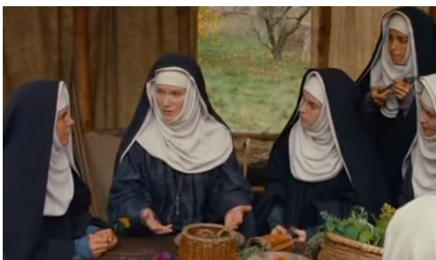
Figura 4 Secuencia de la película « Vision - Aus dem Leben der Hildegard von Bingen », dirigida por Margarethe von Trotta en 2009. En ella se representa a la abadesa Hildegarda instruyendo a sus discípulas sobre plantas curativas.

Los jardines herbarios o monásticos surgen ligados a la regla de San Benito e implican para los monjes un lugar tanto para trabajar como para meditar. En general estaban divididos en un espacio para árboles frutales (viridario), un huerto con verduras y un jardín decorativo. Dados los vastos conocimientos botánicos de Hildegarda, debió de disponer en su vida de un jardín monástico extenso, además de documentarse en la propia naturaleza de su región (fig. 4). A continuación vamos a enumerar algunas de las especies vegetales de su herbolario y su uso para el tratamiento de algunas dermatosis. Hildegarda recoge en su obra tratamientos que son comunes a la medicina popular de muchas