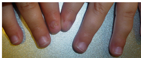
Figura 3 Paciente 3. Presenta polioniquia de índice izquierdo y distrofia ungueal del índice derecho.

Se trata de un cuadro clínico de curso benigno, caracterizado por displasia o ausencia de la uña del dedo índice acompañado de alteraciones óseas en la falange subyacente 4 . Puede afectar a las uñas de las manos como de los pies, tanto de forma uni o bilateral. Baran y Stroud han propuesto como criterios diagnósticos, conforme a sus observaciones y los distintos casos clínicos: 1) hipoplasia unilateral o bilateral del dedo índice y/o de otros dedos de las manos o de los pies (hasta la anoniquia total); 2) alteración radiológica correspondiente a la falange distal del dedo afectado; 3) enfermedad congénita, esporádica o hereditaria. En este último caso, la herencia sería autosómica dominante. No se identificó en la literatura asociación con otro tipo de enfermedad 4,5 .