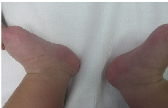
Figura 1 Imagen clínica de un hamartoma fibrolipomatoso en una niña de 5 meses. Obsérvese una tumoración de color piel y consistencia blanda en la región precalcánea del talón izquierdo.

Clínicamente se presenta como una masa solitaria, asintomática, de color piel y consistencia blanda, generalmente localizada, de forma bilateral y simétrica, en la región interna de la cara plantar del talón o región precalcánea. Se