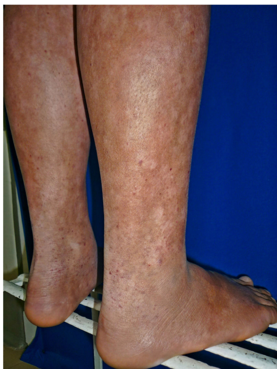
Figura 2 Miosis fungoide tipo capilaritis en una adolescente.