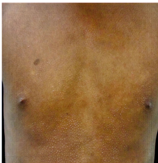
Figura 3 Miosis fungoide tipo liquen espinuloso.

(fig. 2). La MF foliculotropa se presentó en 4 casos (17,4%), uno de estos similar a liquen espinuloso (fig. 3 y tabla 2).