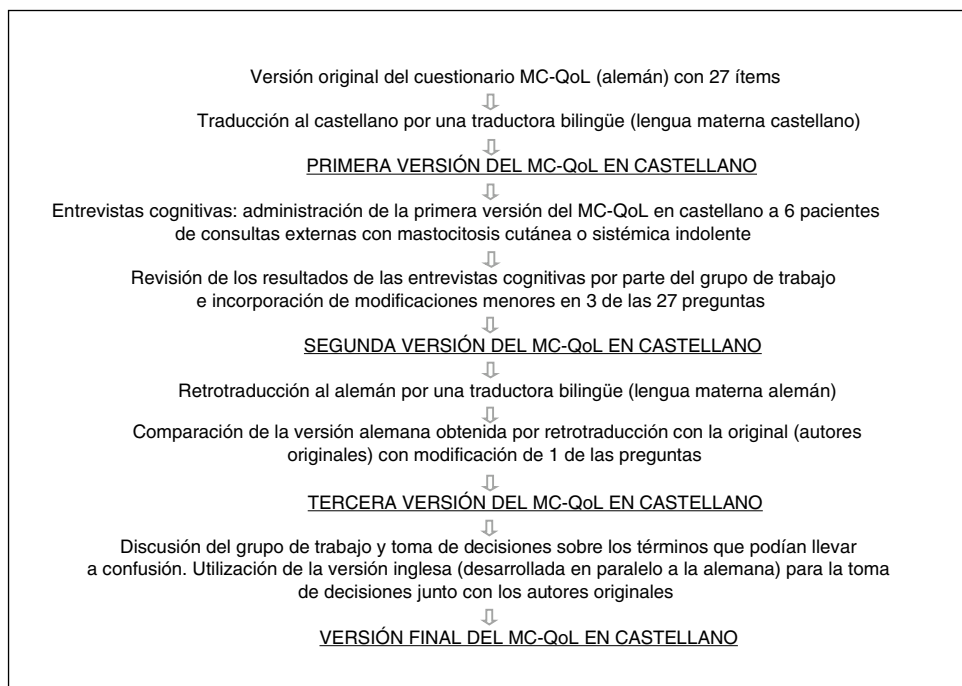
Figura 1 Etapas del trabajo de adaptación lingüística y cultural del cuestionario Mastocytosis Quality of Life questionnaire (MC-QoL) del alemán al castellano.

Tras la revisión y discusión sistemática de los resultados por el grupo de trabajo, se obtuvo la segunda versión del cuestionario, que fue retrotraducida al alemán por una