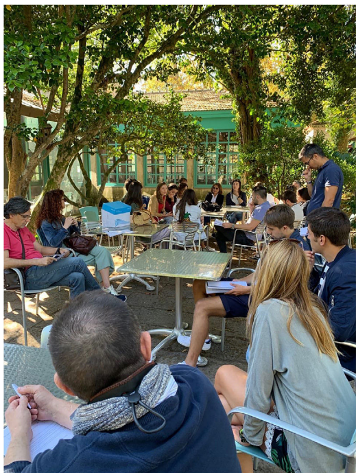
Figura 1 Imagen de la reunión sobre Lectura Crítica de Artículos celebrada en la Isla de San Simón, en la ría de Vigo el 4 de septiembre de 2019.

produce por una simple incapacidad para decidir entre tantas posibilidades, ante una oferta excesiva y en ocasiones de difícil comprensión.