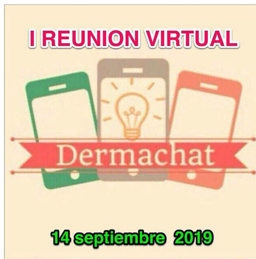
Figura 2 Anagrama del grupo informal de mensajería instantánea Dermachat , en el que participan cerca de 500 dermatólogos, con la leyenda del «I Congreso Virtual Dermachat» que se celebró el pasado sábado 14 de septiembre de 2019.

Es indudable que cualquier congreso, sea de la materia que sea, aporta unos recursos y una riqueza al lugar en el que se realiza con un importante impacto económico. Tanto es así que muchas ciudades desarrollan planes específicos de «turismo de congresos o convenciones» como una estrategia programada con apoyo de administraciones y empresas locales, con mayor o menor éxito. Pero, más allá de esto, ¿cuántos no son los materiales redundantes, superfluos, de vida efímera o fugaz (papeles, folletos, bagatelas, etc.), de consumo de combustibles y de energía, de generación de plásticos y residuos en gran medida evitables que generan nuestras reuniones? ¿Somos conscientes de ello? ¿Somos respetuosos con nuestro entorno? Una de las primeras es la «huella ecológica» que supone la celebración de un congreso tradicional, con liberación de gases con efecto invernadero a la atmósfera secundarios al transporte de asistentes y ponentes, así como al uso intensivo de recursos para su celebración. Un editorial del British Medical Journal de 2008 ponía de relieve que los congresos internacionales pueden contribuir al calentamiento global y deberían considerarse un lujo que nuestro planeta no puede permitirse 5 .