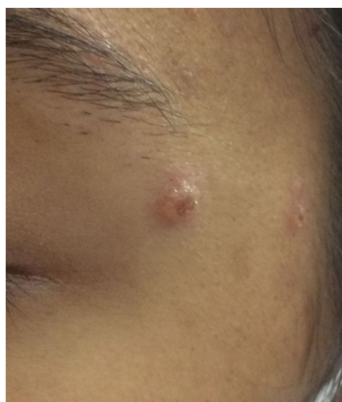
Figura 1 Lesión moluscoide en la cara.

La histología mostró un infiltrado inflamatorio dérmico con neutrófilos, espacios vacuolados y la presencia de estructuras levaduriformes que impresionaban tener cápsula, imagen sugestiva de una criptococosis gelatinosa (fig. 2). Sin embargo, las lesiones cutáneas habían involucionado con tratamiento corticoideo, la radiografía de tórax fue normal y los cultivos, tinciones especiales, además de la antigenemia para Cryptococcus sp. resultaron negativos