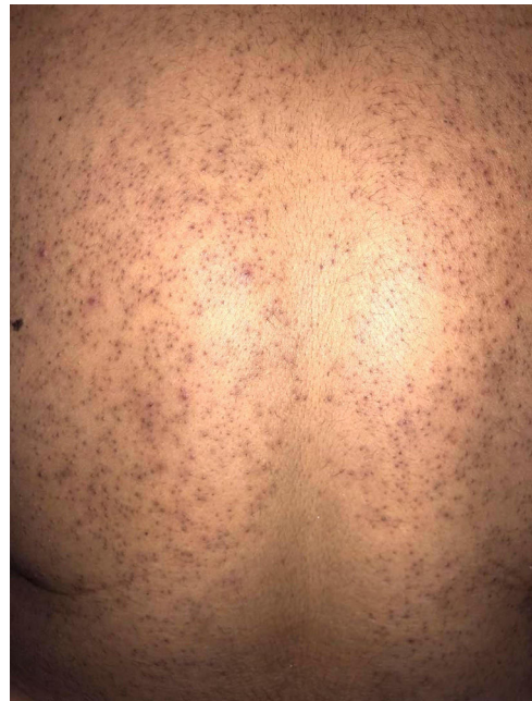
Figura 1 Pápulas foliculares monomórficas en un caso de foliculitis por Malassezia .

La edad media de los pacientes fue de 15,7 \pm 4,3 años, con una ratio varón:mujer de 1:0,8. Todos los pacientes presentaron pápulas y pústulas monomórficas (fig. 1).