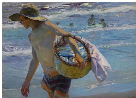
Figura 4 El pescador , 1904.