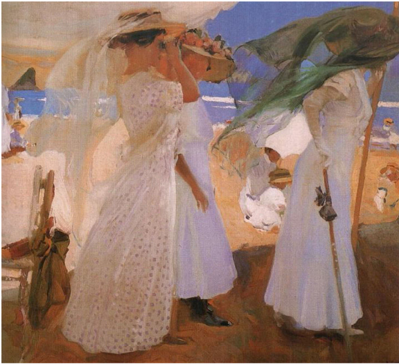
Figura 6 Bajo el toldo, playa de Zarauz, 1905.

cía en la playa, de 1909—, en la playa de Zarauz — Bajo el toldo, playa de Zarauz (1905 y 1910) (fig. 6), Sobre la arena (1910)—, en la playa de San Sebastián — Bajo los toldos (1906)— o en la playa de Biarritz — Instantánea de Biarritz, María en la playa de Biarritz o Contraluz, En la playa de Biarritz, Clotilde bajo el toldo, Elena en la playa, Biarritz, Bajamar, Elena en Biarritz, En la playa de Biarritz o Figura en blanco , todas de 1906—, se aprecia que tanto hombres como mujeres llevan la cabeza tapada con sombrero, portando las mujeres en muchas ocasiones velos para tapar la cara y sombrillas de mano. El vestido de las mujeres es largo y generalmente con manga completa, y el de los varones es el traje de chaqueta blanco 10 .