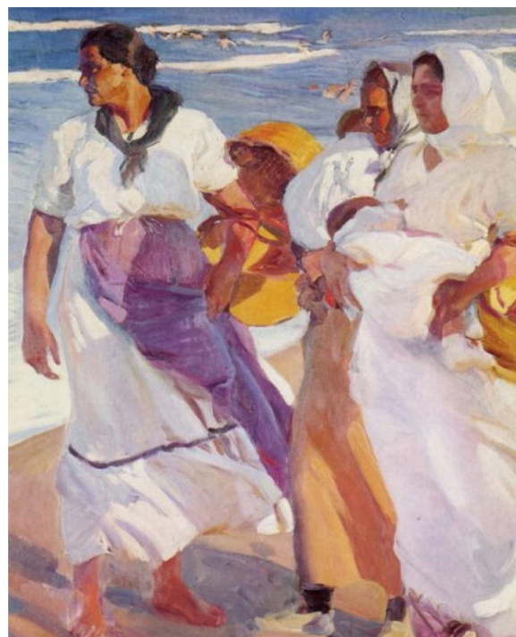
Figura 5 Pescadoras valencianas , 1915.

Cuando las imágenes pertenecen a las clases sociales más favorecidas que veranean en las playas valencianas — Después del baño (1902), Clotilde en la playa (1904) o Paseo a la orilla del mar , Elena en la playa , Antonio Gar-