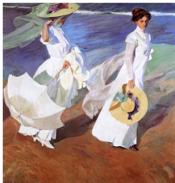
Figura 1 Paseo a orilla del mar , 1909.

El análisis de su obra puede aportarnos datos sobre las costumbres que con respecto a la protección solar tenía la población española del tiempo en el que le tocó vivir.