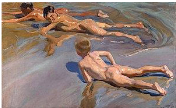
Figura 3 Niños en la playa , 1910.

Estas diferencias se mantienen en aquellos cuadros en los que vemos niños de ambos sexos: Niños en la orilla del mar (1903), Idilio en el mar y Corriendo por la playa (1908) o Niños en la playa (1910).