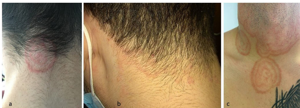
Figura 2 a,b) Formas no inflamatorias. c) Extensión a áreas distantes a la inicial.