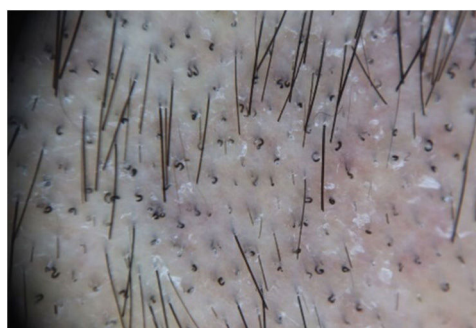
Figura 4 Imagen tricoscópica de pelos «en sacacorchos» típica de la tiña de puntos negros provocada por T. tonsurans .

En las figuras 2 y 3 pueden apreciarse diferentes imágenes de las formas inflamatorias y no inflamatorias recogidas