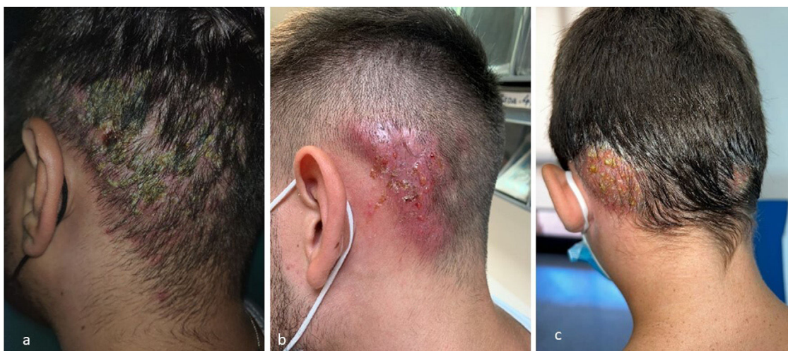
Figura 3 Formas inflamatorias.

de ellos, 106 fueron varones. La media de edad de los pacientes fue de 19 años (rango 5-40 años). La localización inicial, siendo posible más de una simultánea, fue: nuchal-occipital en 90 casos (84%), temporal-retroauricular en 17 casos (15,8%), facial en 4 (3,7%), preauricular en 2 (1,8%), espalda en 1 (1%) y no especificada en 2 (1,8%) (fig. 1a). La mayoría, 65 (60,7%), no se extendieron a otras zonas, mientras que, cuando sí lo hicieron, las áreas afectadas fueron las representadas en la figura 1b.