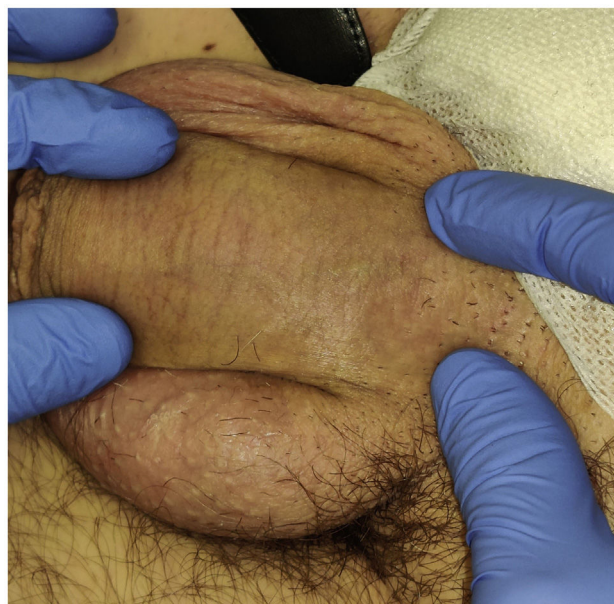
Figura 1 Imagen clínica del cordón subcutáneo indurado. Dicho cordón seguía un trayecto lineal a lo largo del dorso del pene y tenía una amplitud de 4 mm.

otras causas de trombofilia primaria y administró un tratamiento con heparina de bajo peso molecular (HBPM). La evolución clínica fue favorable y mediante un seguimiento ecográfico seriado se pudo constatar la resolución de la trombosis a los 2 meses. Tras la resolución se suspendió la HBPM y a los 18 meses de seguimiento no se ha constatado la aparición de recidivas ni tromboflebitis en otros territorios.