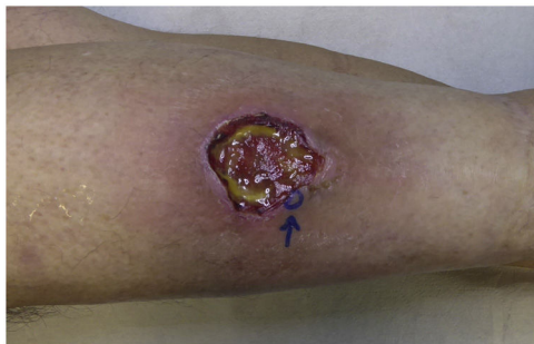
Figura 1 Úlcera de bordes violáceos mal definidos y fondo fibrinoide en cara anterior de la pierna.

Un hombre de 53 años, con antecedentes de artritis reumatoide de 15 años de evolución mal controlada, estaba siendo atendido en cirugía general, por una úlcera de dos meses de tórpida evolución localizada en la pierna izquierda, desarrollada tras un traumatismo (fig. 1). Fue remitido a dermatología por la aparición de unas úlceras nuevas en el área genital. A la exploración se observaba una placa necrótica en el glande y prepucio con edema del cuerpo del pene (fig. 2a). En ingles se palpaban adenopatías blandas y rodaderas de gran tamaño. Con el diagnóstico empírico de sífilis primaria se administraron 2.400 mil UI de penicilina por vía IM y se tomó una muestra de sangre para una analítica general con serología para VIH, virus hepatotropos y sífilis. En urología, se realizó una circuncisión para eliminar la escara necrótica, añadiendo prednisona 30 mg/24 h. Sin embargo, el paciente una semana más tarde acudió de nuevo al hospital, con una dehiscencia de las suturas y un aumento del tamaño de la necrosis (fig. 2b). La serología fue negativa y el hemograma presentó una leucopenia (1200/ \mu l), una neutropenia (150/ \mu l) y una anemia (hemoglobina 11,2 g/dl). El estudio anatomopatológico de la pieza quirúrgica informaba de ulceración, inflamación crónica, vasculitis con trombosis y necrosis isquémica (fig. 3).