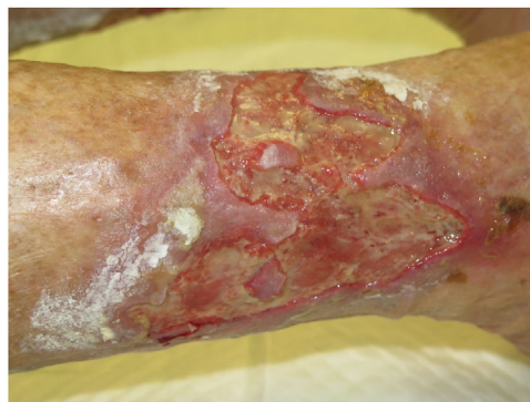
Figura 2 Úlcera por arterioesclerosis secundaria a edema agudo por insuficiencia cardíaca descompensada.

pio, la presión ejercida de forma externa y continua no debe superar la presión intraarterial y arteriolar. Por ello, se ha establecido que la terapia compresiva está contraindicada si el índice tobillo-brazo es inferior a 0,6 27 . Sin embargo, los pacientes con arteriopatía periférica leve pueden beneficiarse de la terapia compresiva. De hecho, se ha demostrado un aumento del flujo arterial en estos pacientes con el uso de vendajes de alta rigidez o dispositivos de compresión neumática 27 . En pacientes inmóviles con arteriopatía periférica e índice tobillo-brazo > 0,5, el vendaje con un alto índice de rigidez con presiones menores de 30 mmHg es una opción segura y efectiva si se realizan ejercicios de dorsiflexión del pie. Además, es posible obtener un doble beneficio, ya que la reducción resultante del edema puede mejorar el flujo arterial 28 .