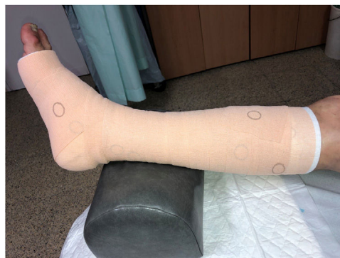
Figura 4 Vendaje multicomponente con marcadores de presión circulares.

Es una alternativa a las vendas de corto estiramiento. Están disponibles como kits para usar de una a 4 vendas. Incluyen varios componentes, como vendas acolchadas, vendas de corto estiramiento, vendas de largo estiramiento, vendas de espuma especial, algunas de las cuales contie-