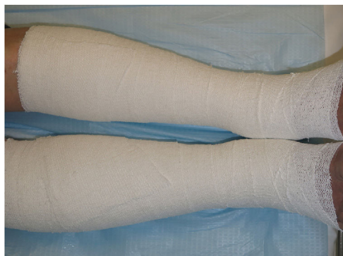
Figura 3 Bota de Unna.