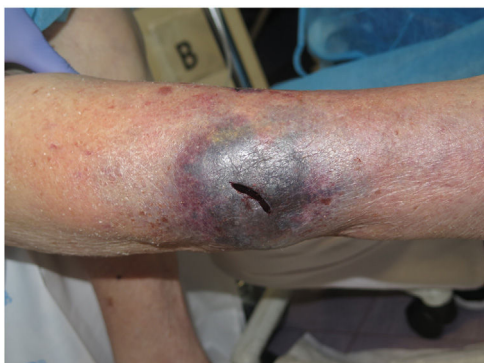
Figura 1 Tras el drenaje de un hematoma profundo disecante se aplicará terapia compresiva adaptada a la persona.