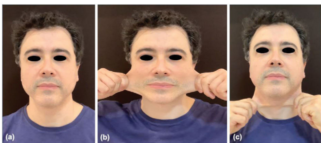
Figura 3 Evaluación facial del paciente transcurridos 180 días del segundo protocolo de tratamiento – dos sesiones de tratamiento de cara completa con intervalo mensual en 2021. Posición de reposo (a), extensibilidad de la piel lateral (b) y anterior (c) que refleja incremento del grosor y resistencia de la piel.

y/o de COL1A1, genes asociados a la producción de colágeno de tipo V y tipo I, respectivamente 6 .