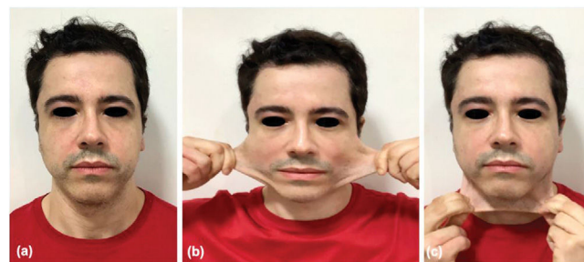
Figura 1 Evaluación facial del paciente en posición de reposo (a), extensibilidad de la piel lateral (b) y anterior (c) que refleja hiper movilidad y laxitud intensa de la piel.

Un varón caucásico de 36 años, diagnosticado de EDS clásico desde la infancia, acudió a una consulta dermatológica a finales de 2019. Reportó hiper movilidad articular generalizada, hiperextensibilidad de la piel y formación de cicatrices atróficas. El paciente no exhibió otras comorbilidades. Reportó laxitud de la piel del rostro con un impacto