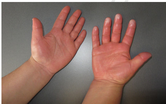
Figura 1 Caso 1: Hiperhidrosis, edema y cianosis acra de la mano derecha.

En la exploración física, se observó un edema, eritema e hiperhidrosis en la palma derecha y una cianosis acral (fig. 1). A la palpación supraclavicular derecha presentaba